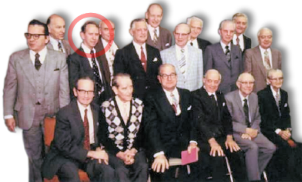
Il Corpo Direttivo dei Testimoni di Geova del 1975

L'Organo che dirige i Testimoni di Geova e ne scrive i libri e le riviste