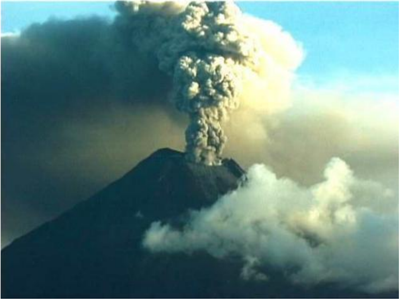
"Ceneri oscurano il cielo, nuovo stop negli scali Europei" aprile 2010

Allora si vedrà il Figlio dell'uomo venire sulle nuvole con grande potenza e gloria. Ed egli allora manderà gli angeli a raccogliere i suoi eletti dai quattro venti, dall'estremo della terra all'estremo del cielo. Ora imparate dal fico questa similitudine: quando i suoi rami si fanno teneri e mettono le foglie, voi sapete che l'estate è vicina. Così anche voi, quando vedrete accadere queste cose, sappiate che egli è vicino, alle porte. In verità vi dico che questa generazione non passerà prima che tutte queste cose siano avvenute. Il cielo e la terra passeranno, ma le mie parole non passeranno.