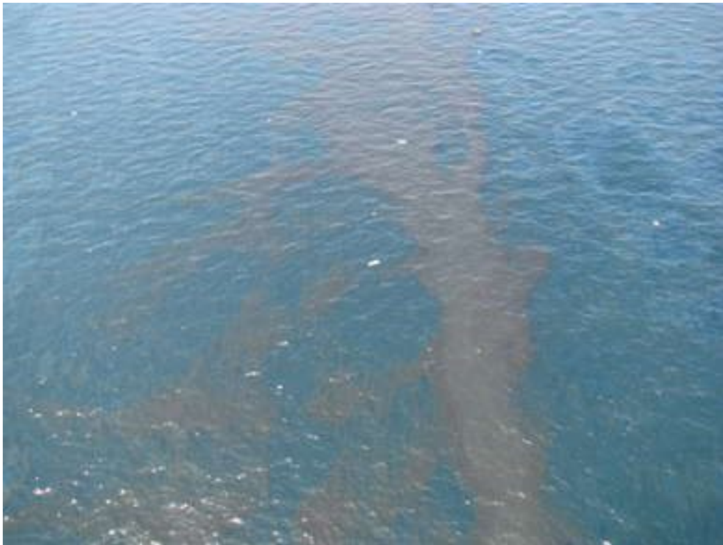
Marea nera: sabato 1 maggio 2010 sulle coste Louisiana

Se il Signore non avesse abbreviato quei giorni, nessuno scamperebbe; ma, a causa dei suoi eletti, egli ha abbreviato quei giorni. Allora, se qualcuno vi dice: "Il Cristo eccolo qui, eccolo là", non lo credete; perché sorgeranno falsi cristi e falsi profeti e faranno segni e prodigi per sedurre, se fosse possibile, anche gli eletti. Ma voi, state attenti; io vi ho predetto ogni cosa. Ma in quei giorni, dopo quella tribolazione, il sole si oscurerà e la luna non darà più il suo splendore; le stelle cadranno dal cielo e le potenze che sono nei cieli saranno scrollate.