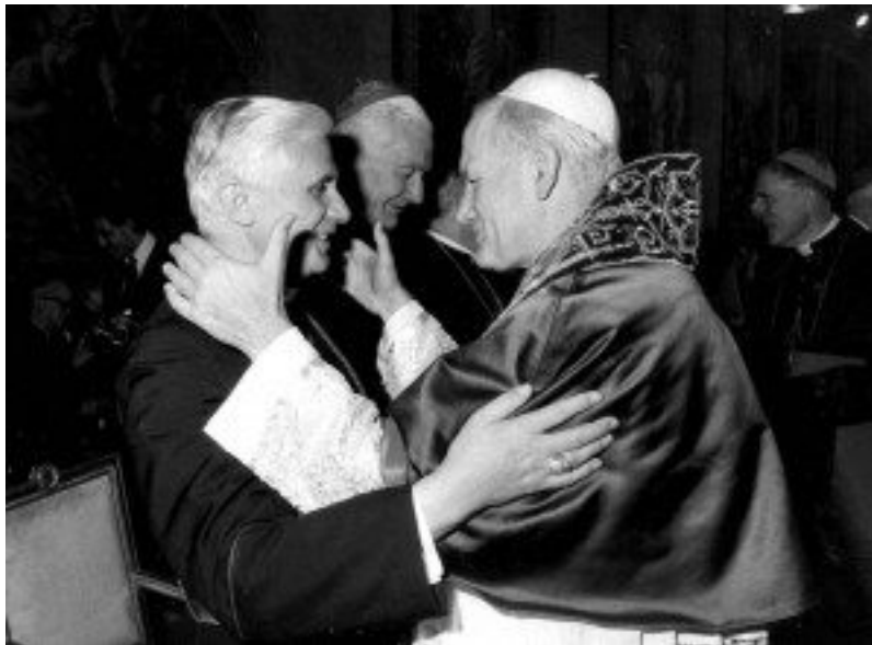
Papa Giovanni Paolo II con il cardinale Ratzinger, prefetto della Congregazione per la dottrina della fede

Tra le rivelazioni spunta un vertice segreto avvenuto in Vaticano nel 2000 tra Ratzinger e i vescovi delle nazioni anglofone più colpite dagli scandali di pedofilia: Stati Uniti, Irlanda, Australia. Secondo il vescovo Geoffrey Robinson di Sidney, che partecipò all'incontro segreto, Ratzinger "impiegò molto più tempo a riconoscere il problema degli abusi sessuali, rispetto a quel che fecero alcuni vescovi locali" . Nell'intervista al New York Times il prelado australiano si chiede: "Perché il Vaticano era così tanti anni indietro?" .