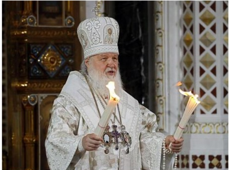
Il Patriarca di Mosca Kirill