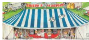
Tenda itinerante di evangelizzazione