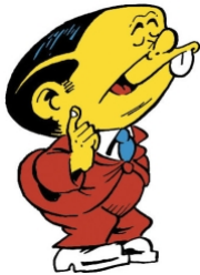
Motti a sfondo cristiano