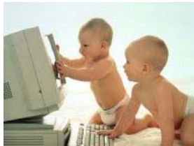
In questa pagina alcune cose utili per i più piccoli