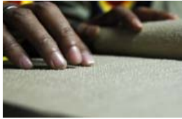
Opera Cristiana Evangelica a favore dei "non vedenti"